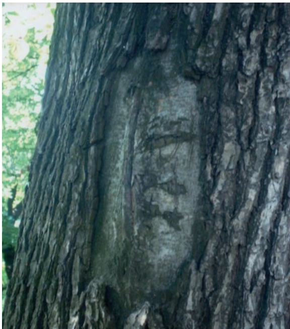
Сохранившийся след от артобстрела на липе в Михайловском саду